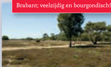
Brabant; veelzijdig en bourgondisch!