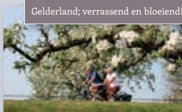
Gelderland; verrassend en bloeiend!