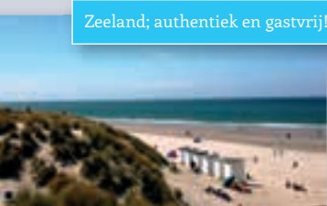
Zeeland; authentiek en gastvrij!