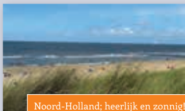
Noord-Holland; heerlijk en zonnig!